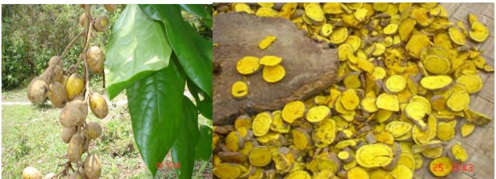
Fibraurea tintoria Lour. or F. recisa Pierre (ແຮມຂຽວ)