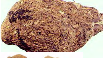
ເຫັດແປກ, Poria cocos F.A. Wolf. (Polyporaceae)ບໍາລຸງ