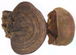
ເຫັດຊື້ນ Ganoderma applanatum (Pers. Ex Wallr. Patouillard