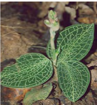
Anoetochilus lylei Rolfe ex Downie (ຊະນິດຂຽວ)