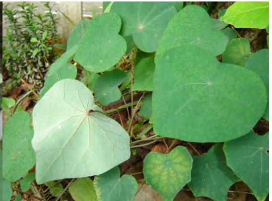
(ຕ່ອມເລືອດ)