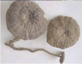
ເຫັດຂອນຂາແຂງ Amauroderma sericatum (Lloyd) Wakefield