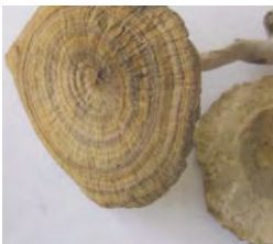
ເຫັດນົມເສືອ, ເຫັດຫອນເຫງືອກ Lanosus sacer (Afzel. ex Fr.) Ryvardeen