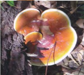
ເຫັດຫຼົງຈີ່ຂອບຂາວ Ganoderma tsugae Murrill