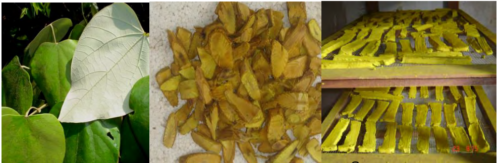
Coscinium fenestratum (Gaertn.) Colebrooke (ແຮມເຫຼືອງ)

ຄຸນປະໂຫຍດ : ປົວທ້ອງບິດ, ທ້ອງຖອກ, ເປົາຫວານ