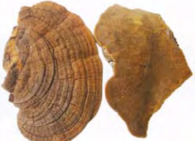
ເຫັດແດງ Phellinus pomaceus (Pers.)Maire