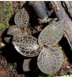
Anoetochilus formosus Hayata.(ຊະນິດແດງ)

ຄຸນປະໂຫຍດ : ບຳລຸງສຸຂະພາບ, ເຮັດໃຫ້ຜົວພັນນຸ້ມນວນ ແລະ ຂາວ