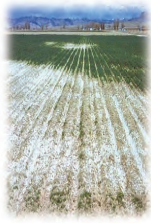
ພິດຕົກຄ້າງໃນດິນເຮັດ ໃຫ້ການແຕກງອກ ຂອງພືດຫຼຸດລົງ