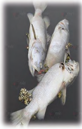
ທາດພິດມີຜົນກະທົບ ຕໍ່ສັດນ້ຳ