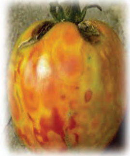
ເຮັດໃຫ້ຜົນຜະລິດ ເສຍຫາຍ