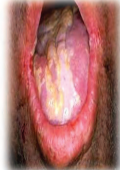
ປາກ ແລະ ລິ້ນເປື້ອຍ