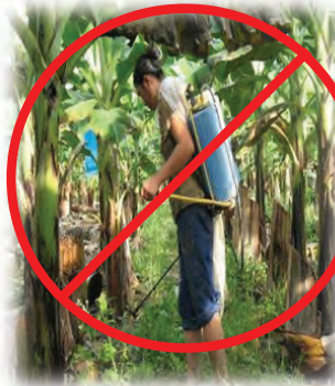
ຍຸດການສີດຢາປາບສັດຕູ ພືດບໍ່ໃສ່ຊຸດປ້ອງກັນຕົວ