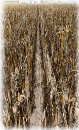
ເປັນພິດເຮັດໃຫ້ຕົ້ນພືດ ຕາຍ