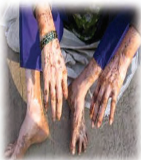
ຜິວໜັງເປື້ອຍ ແລະ ເປັນ ຜິ່ນແດງ