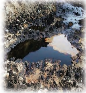
ເປັນມົນລະພິດໃນ ສິ່ງແວດລ້ອມ